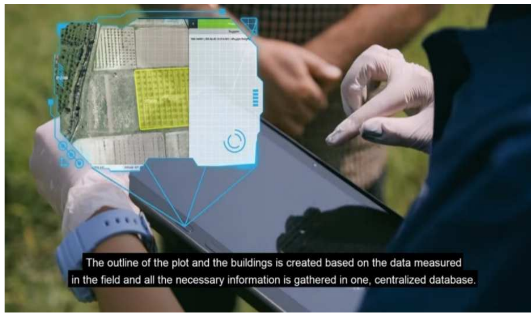
The outline of the plot and the buildings is created based on the data measured in the field and all the necessary information is gathered in one, centralized database.